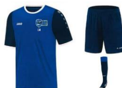
KIT inclus dans la cotisation Y compris marquage Logo du club + Initiales Tailles 6 ans à 2XL