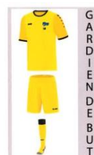
G A R D I E N D E B U T