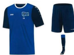
KIT inclus dans la cotisation Y compris marquage Logo du club + Initiales Tailles 6 ans à 2XL