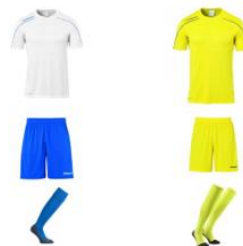
Kit inclus dans la cotisation Y compris logo du club + initiales