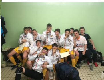
Champion de France UNSS Excellence Futsal Avranches 2018