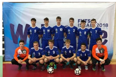
Championnat du monde ISF Futsal- Israël 2018